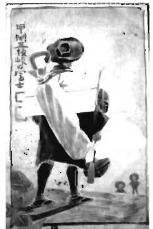
写真② 吉澤儀造からの葉書